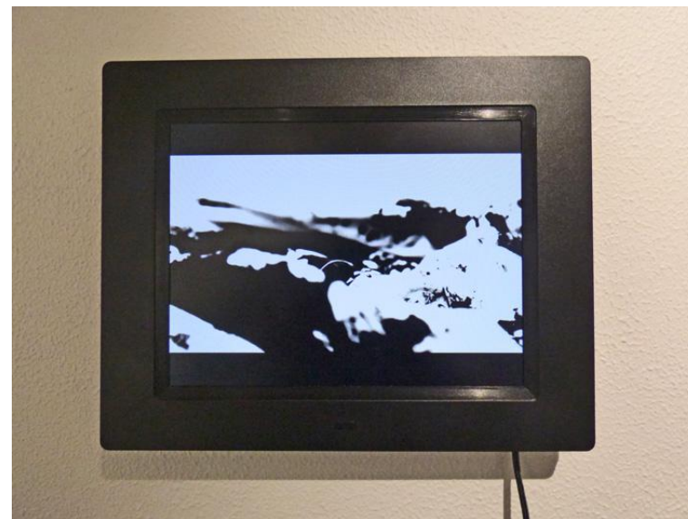
Léna DESCOTTES, Entre deux encres , 2016, encre, peinture, tissus, ficelle, vidéo.

Parcours : Bac L - arts plastiques spécialité puis licence 3 d'arts plastiques à l'université de Rennes 2 en développant un travail sur le corps, la trace, l'empreinte et la couture. Depuis, pratique intensive de la musique en particulier le chant et la musique irlandaise.