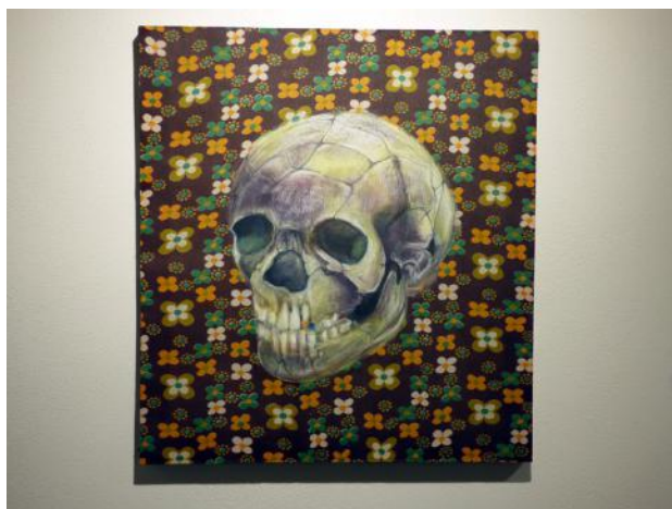
Léonore DESTRES, Autotelic Flag, 2018.

Maillots de Basquet, chaîne et tube en aluminium, 200 x 120 cm.