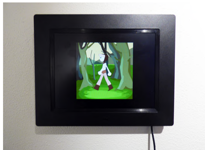
Morgane LE CALVEZ, Walk On , 2019, travail digital.

Pour en savoir plus : https://www.mathildemelekan.com/home