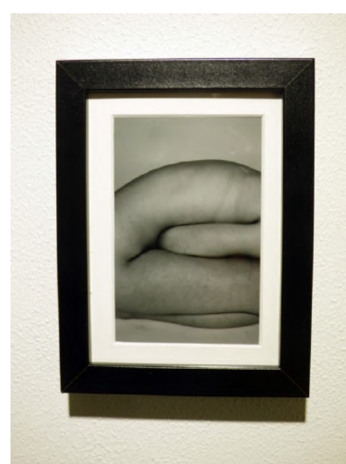
Alisson TEFFAUD, Snail (Escargot) , 2019.