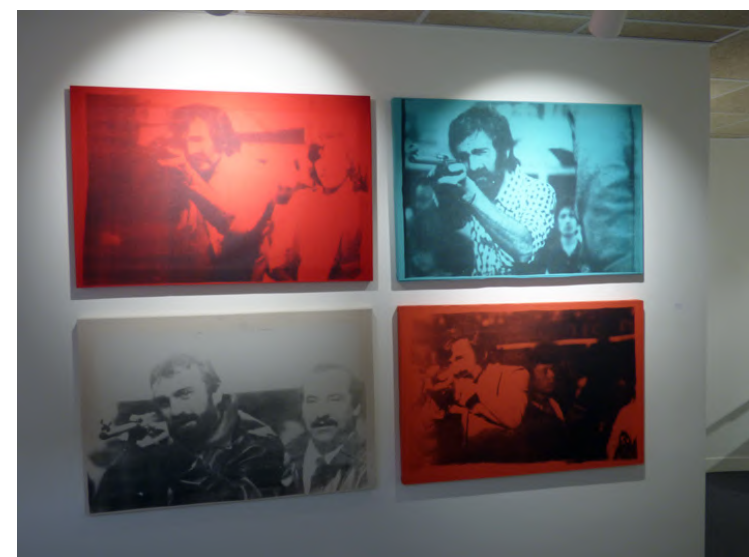
Mathilde AN, Shoot the Time #1, 2, 3, 4 , 2010, sérigraphie sur toile, 70 x 90 cm.

Parcours : Bac L - arts plastiques spécialité puis licence 3 d'arts plastiques à l'université de Rennes 2 en développant un travail sur le corps, la trace, l'empreinte et la couture. Depuis, pratique intensive de la musique en particulier le chant et la musique irlandaise.