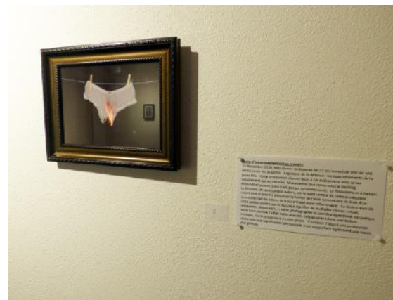
Angèle HELEINE, Brûlons les preuves , 2019.