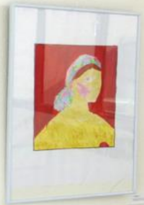
Small informational card or label placed below the framed portrait painting.