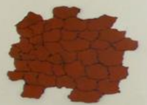
Small informational card or label placed below the red abstract wall sculpture.