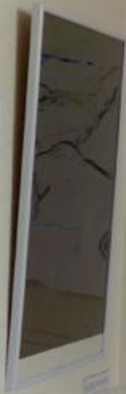
3. Public Space A framed abstract artwork with a dark background and light, branching, vein-like patterns.