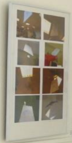
Small informational card or label placed below the framed collage artwork.