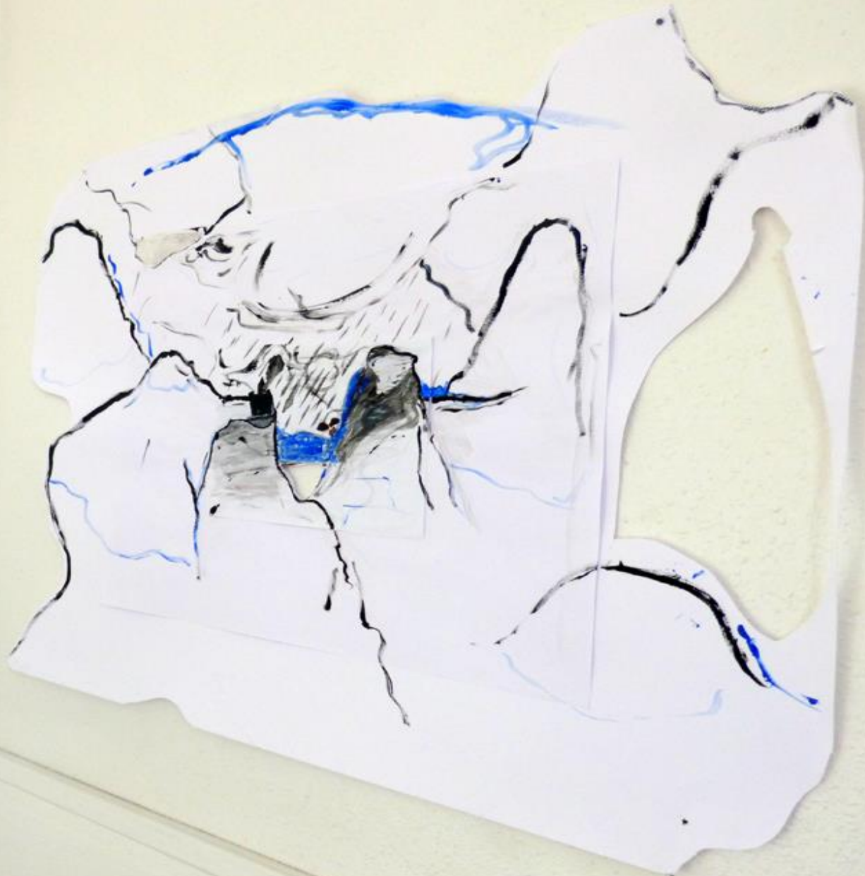
« L'art, c'est de nature vue à travers un tempérament d'homme » Gauguin