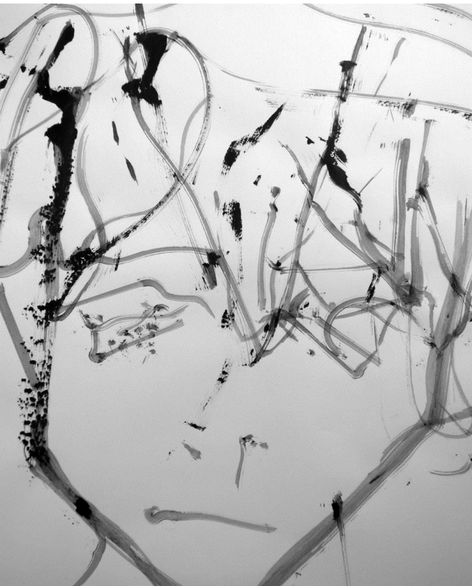
Christopher Dauvin, acrylique sur papier.