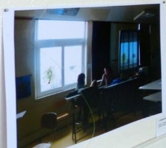
1. Public Space A photograph of a public space, possibly a library or study area, with people sitting at tables near large windows. The photo is mounted on a white frame.