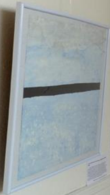
2. Public Space A framed abstract artwork featuring a light blue and white background with a prominent dark horizontal band across the center.