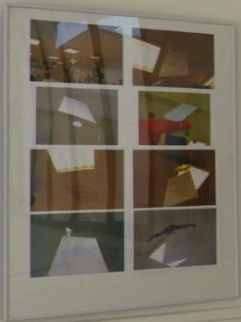
1. Die Teilnehmerinnen und Teilnehmer der ersten Sitzung des Arbeitskreises „Kultur und Politik“ am 14. März 2003.